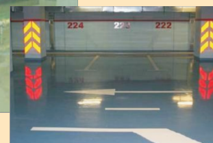
Производственные помещения, паркинги